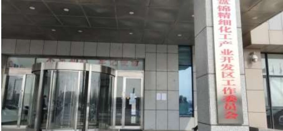
图 3-4 项目周边张贴公告现场照片