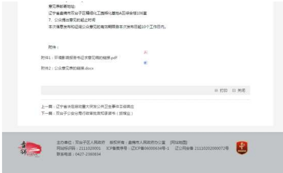
图 3-1 环评报告征求意见稿网络公示截图