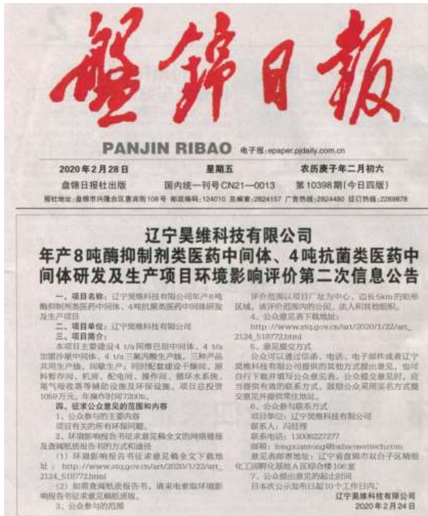
图 3-3 环评报告征求意见稿第二次报纸公示截图