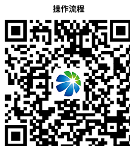
2. 暂停、停用供燃气申报