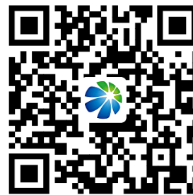
奥德燃气服务事项清单