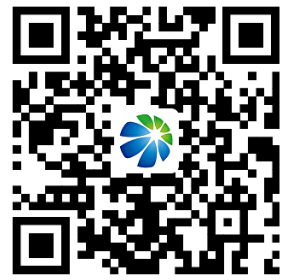
奥德燃气业务办理大厅