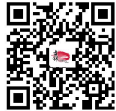
违规禁办事项清单