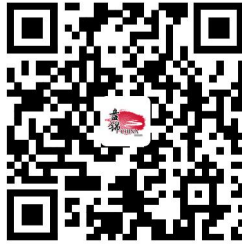
14.海域使用权设立审核