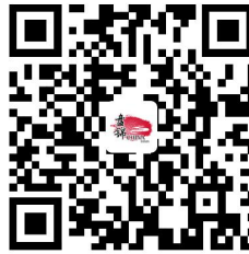
9.建设工程规划许可证核发