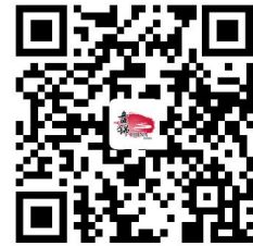
容缺事项办理清单