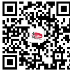
10.建设工程规划许可证变更