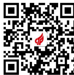
容缺办理事项清单