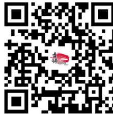
5.国有建设用地使用权及房屋所有权受遗赠、继承转移登记