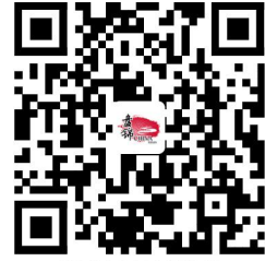
容缺事项办理清单