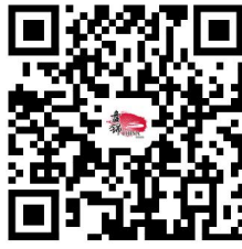
3.国有建设用地使用权及房屋所有权转移登记（新建商品房）