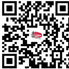
4. 国有建设用地使用权及房屋所有权转移登记（二手房买卖）