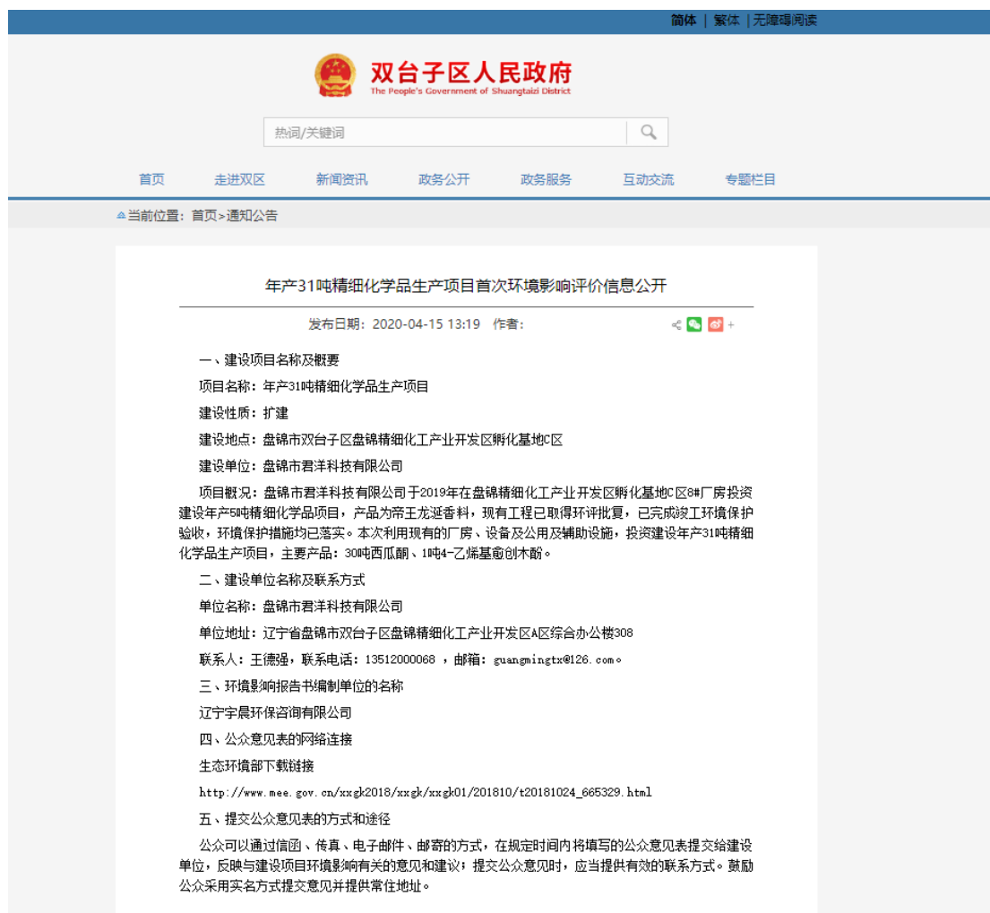
图 2-1 第一次公示内容截图