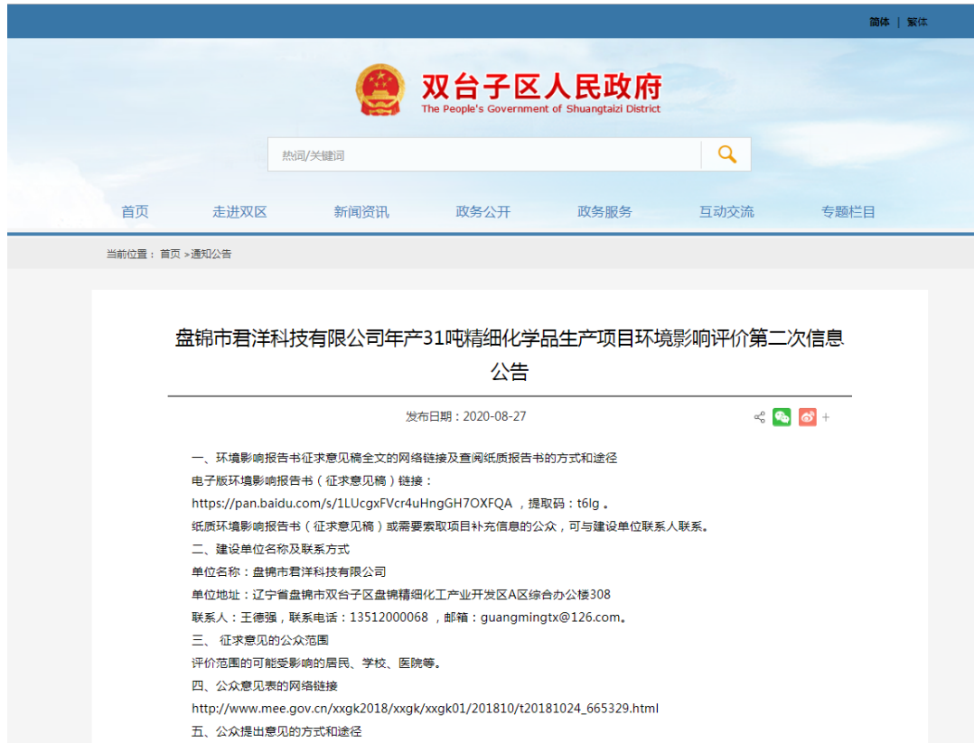
图 3-1 征求意见稿公示内容截图